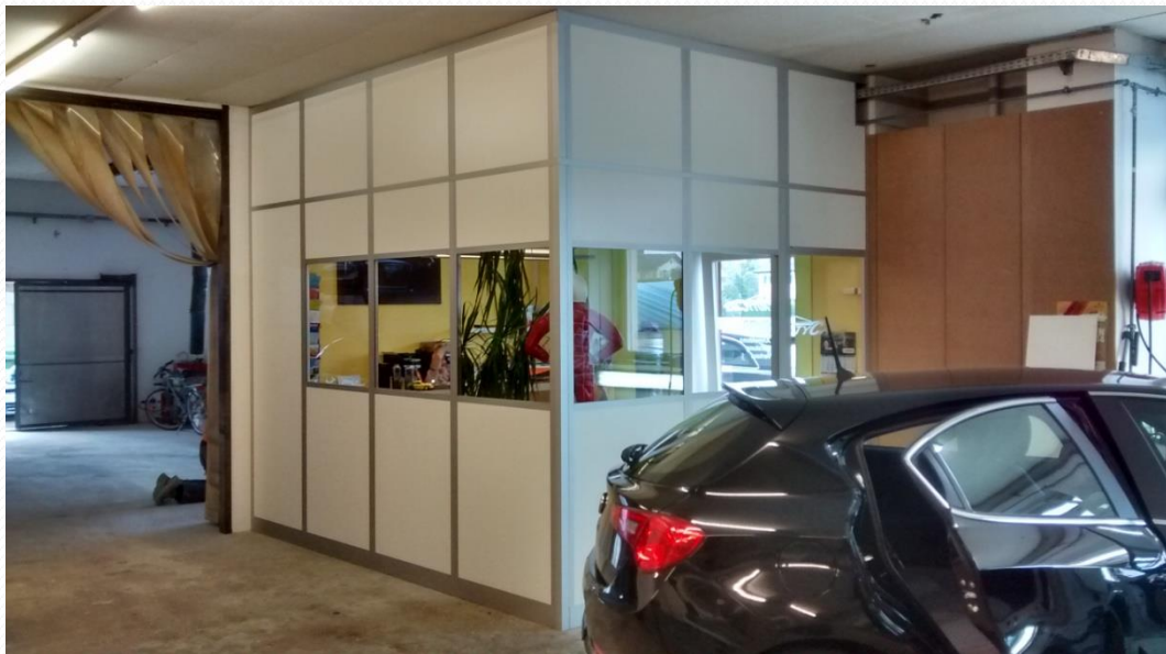
Werkstattbüros und Abtrennungen