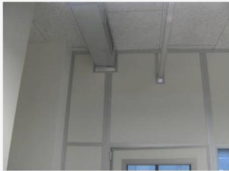
Anpassen an bestehende Leitungen

RTW32 Meisterkabinen Raumtrennwände Raum im Raum System