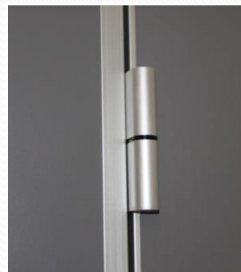
Aluminiumbänder mit Laufflächen aus Hochleistungspolymer